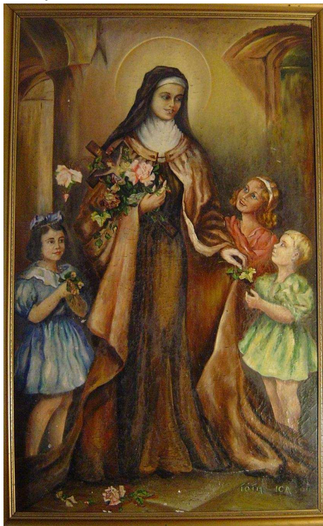
Lisieux-i Kis Szent Teréz az egykori Piroskavárosi zárdaiskola kápolnájának oltárképén

hatalmával együtt add meg nekik a lelkeket átváltoztató erőt is. Áldd meg munkájukat bő terméssel és ajándékozd nekik egykor az örök élet koronáját. Ámen.