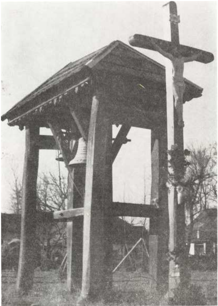
Kereszt és harangok Bokroson, 1982