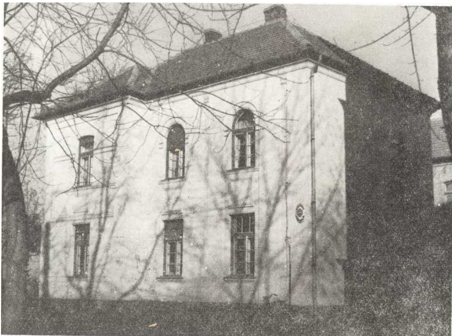
A Szabadság téri Általános Iskola – az egykori ferences kolostor és a Szent József plébánia