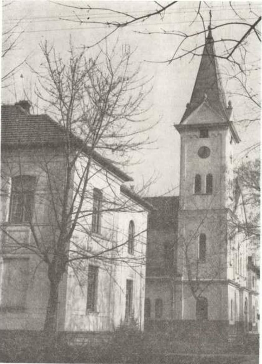
A piroskavárosi Szent József-templom és az egykori ferences kolostor