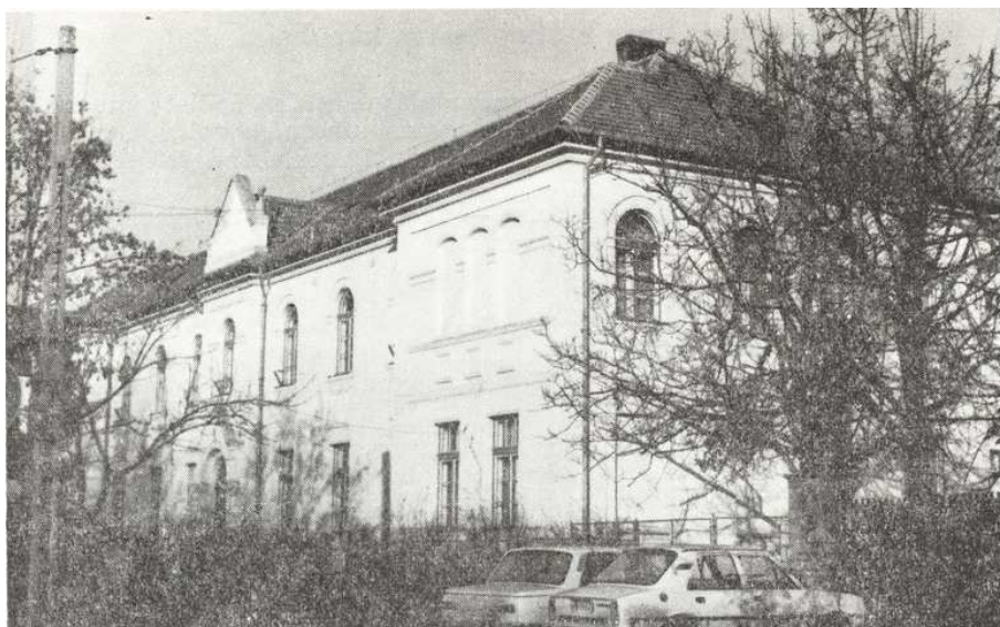
A csongrádi Szabadság téri iskolaépület – az egykori apácázárda