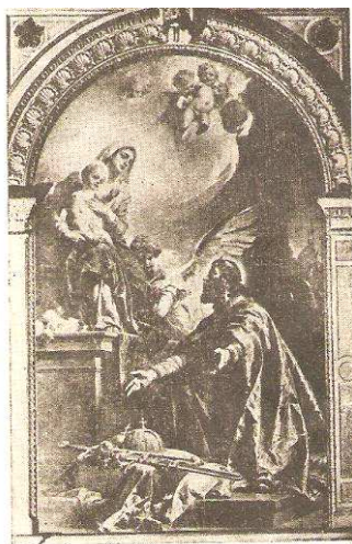
Boldogasszony Anyánk, Régi nagy Pátrónánk!