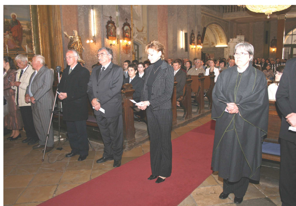
Pillanatkép a Képviselőtestület eskütételéről 2009. május