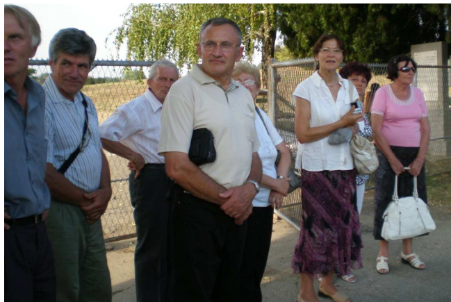
Óbecsén 2009. augusztusban