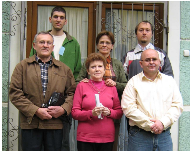
Debrecen, Sajtóapostolok IX. Országos Találkozója, 2010

Isten jelen maradjon a közösségben akkor, amikor ez csak a kiváltságosoknak sikerült. A katona feladata, hogy megvédje a népét, a családját, de az egyházközösséget is. Megharcolta a jó harcot, a pályát végigfutotta , Isten biztosan az atya szeretetével várta. És még egy gondolat: Jó katona volt, aki az életét a haza szolgálatába, míg őt, hazája Isten szolgálatába állította. Katona és EMBER, hangsúlyozta, aki a katonaság nevében búcsúztatta.