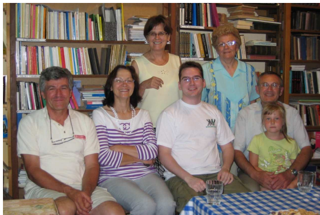
Plébániánkon 2010. júliusban